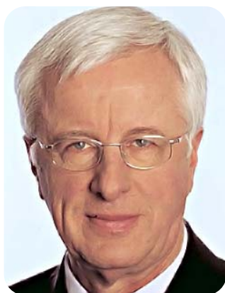
Hartmut Nassauer MdEP

Die EVP-ED-Fraktion im Europaparlament wird härtesten Widerstand leisten, falls die Beratungen zur Bodenschutzrichtlinie im Rat wieder aufgenommen werden sollten. Das sagte der stellvertretende Vorsitzende der größten Parlamentsfraktion, Hartmut Nassauer (CDU). „Bodenschutz ist eine hoch bedeutsame, aber keine europäische Aufgabe. Grenzüberschreitende Wirkungen, die eine europäische Gesetzgebung rechtfertigen würden, gehen vom Boden nicht aus“, so der CDU-Europaabgeordnete, der das Dossier im Rechtsausschuss betreute, während der Plenar-