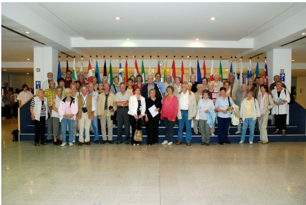
Ruth Hieronymi mit Bürgerinnen und Bürgern aus Hennef im Europäischen Parlament in Brüssel im Juni 2008