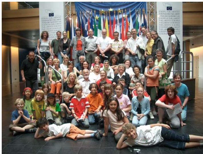
Ruth Hieronymi freute sich 2006 über den Besuch der Marienschule im Europäischen Parlament in Straßburg

Im Bereich des Austausches bei der beruflichen Bildung werden in diesem Jahr das Friedrich-List-Berufskolleg, das Robert-Wetzlar-Berufskolleg, die Stiftung Begabtenförderungswerk berufliche Bildung, die Arbeiterwohlfahrt und die AEQUA GmbH, eine gemeinnützige GmbH der deutschen Wirtschaft mit Sitz in Bonn, gefördert.