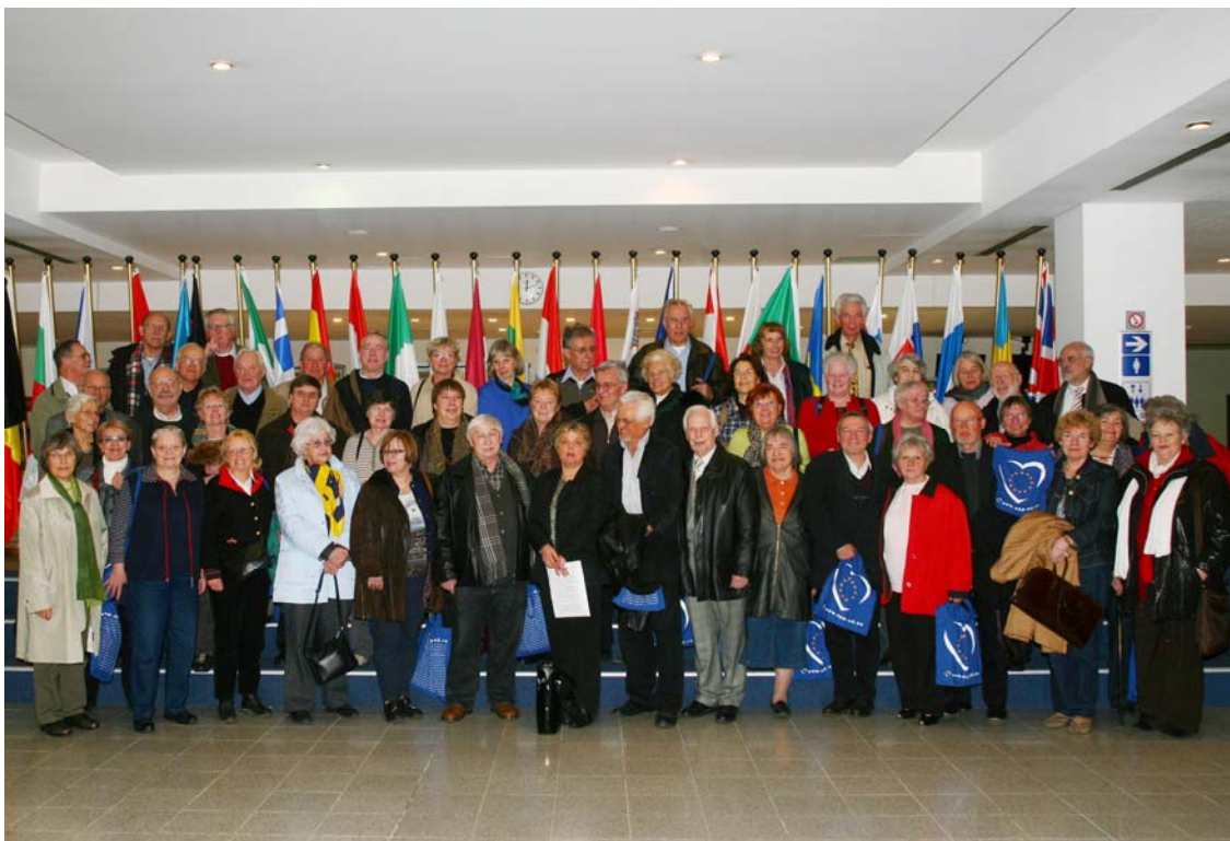
Der Städtepartnerschaftsclub Köln im Europäischen Parlament in Brüssel am 2. April 2008.