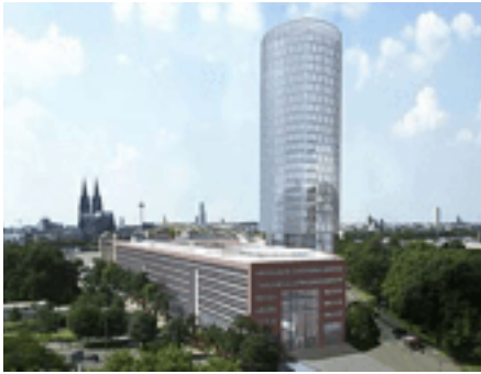
Die EASA in Köln

European Aviation Safety Agency (EASA) Ottoplatz 1, 50679 Köln Tel.: 0221 8999 000 Fax: 0221 8999 099