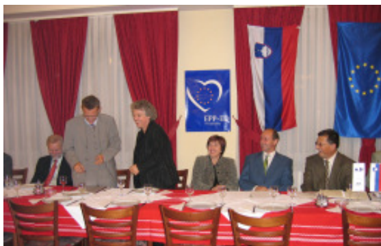
Jahreshauptversammlung der NSi in Moravce

Zu einem Arbeitsbesuch war Ruth Hieronymi im Oktober 2005 in Slowenien. Auf Einladung der EU-Abgeordneten Ludmilla Nowak von der Partei Nova Slovenija (NSi), mit der sie in der Fraktion der EVP und im Kulturausschuss des Europaparlaments zusammenarbeitet, besuchte sie das Land. Gespräche mit Vertretern der Medien, der Politik und der Wirtschaft standen auf dem umfangreichen Besuchsprogramm.