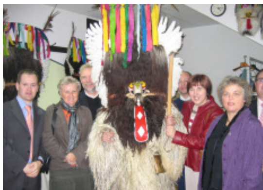
Besuch bei einem Maskenschnitzer in Ptuj

Der schmale Küstenstreifen Sloweniens grenzt an Italien und Kroatien, mit dem es noch Grenzstreitigkeiten gibt. Diese Streitigkeiten muss Kroatien lösen, bevor es EU-Mitglied werden kann.